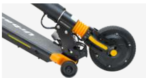
Rodas de transporte