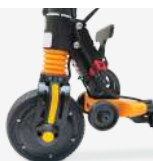
Frein à tambour