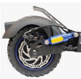
Freno de disco