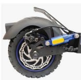
Travão de disco