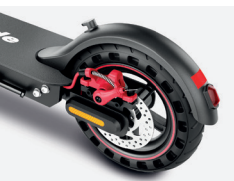
Frein à disque